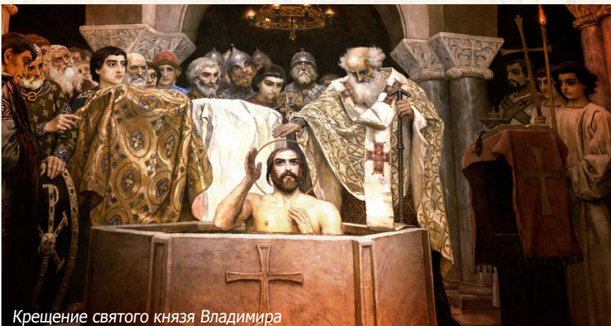
Крещение святого князя Владимира

В 988 году н. э. в Херсонесе принял крещение святой равноапостольский князь Владимир! Именно отсюда Вера Православная