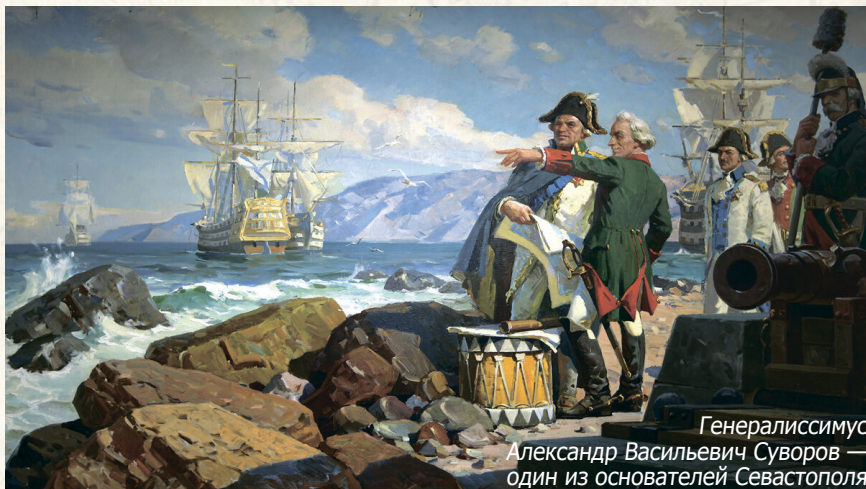
Генералиссимус Александр Васильевич Суворов — один из основателей Севастополя

В этой связи хочу выразить искреннюю благодарность всем тем, кто придумал эту концепцию, тем кто спроектировал, и тем, кто реализовал этот уникальный проект! Спасибо всем, от Прези-