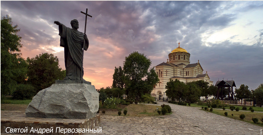
Святой Андрей Первозванный

– В 655 году н. э. в Херсонесе Таврическом отошел к Господу сосланный сюда императором Константином II, и замученный голодной смертью 74-й Римский папа святой Мартин I, прозванный Исповедником. Храм его памяти находится в Свято-Климентском Инкерманском монастыре!