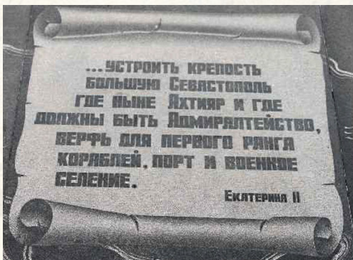
Устроить крепостю большую Севастополь...

Раз мы начали рассказ о военной составляющей, то сразу скажу, что эта часть истории моего Города, в большей мере относится к событиям двух его славных оборон, которые правда, к большому сожалению, никак нельзя назвать военными победами!