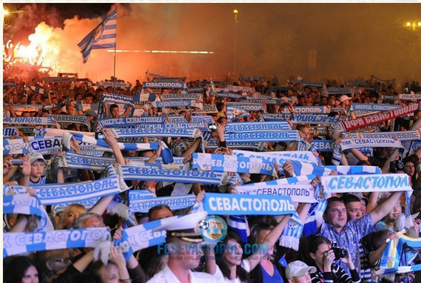
Мы - Севастополь!

А теперь я расскажу Вам еще об одной традиции украинских времен. Она была реально крута, потому, что в ней участвовали байкеры и автомобилисты!