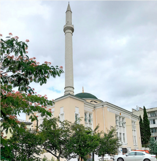
Мечеть Акъяр - Джами

а на улице Очаковцев возвышаются стройные минареты мечети Акъяр Джами. Кстати, история этой святыни тоже насчитывает больше ста лет, а часть средств на ее строительство пожертвовала императорская семья, о чем повествует надпись на фасаде.