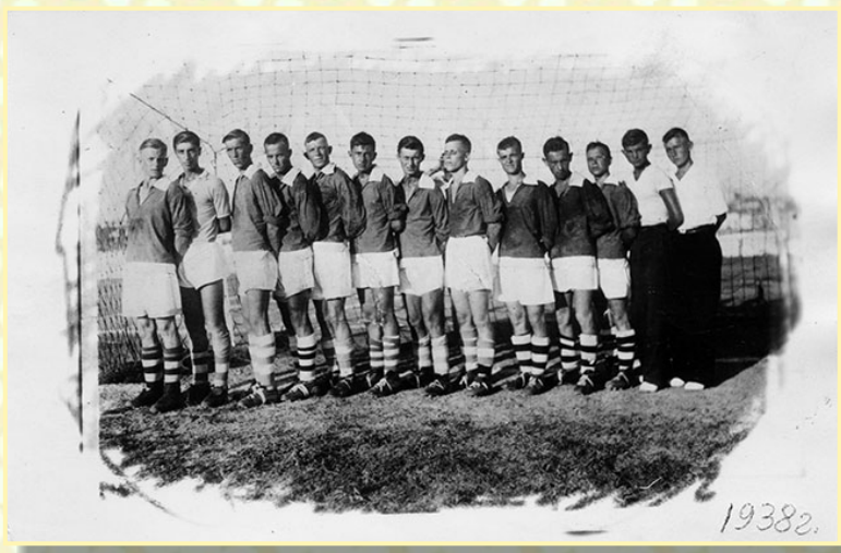
«Судостроитель» Севморзавод вторая команда. 1938 год