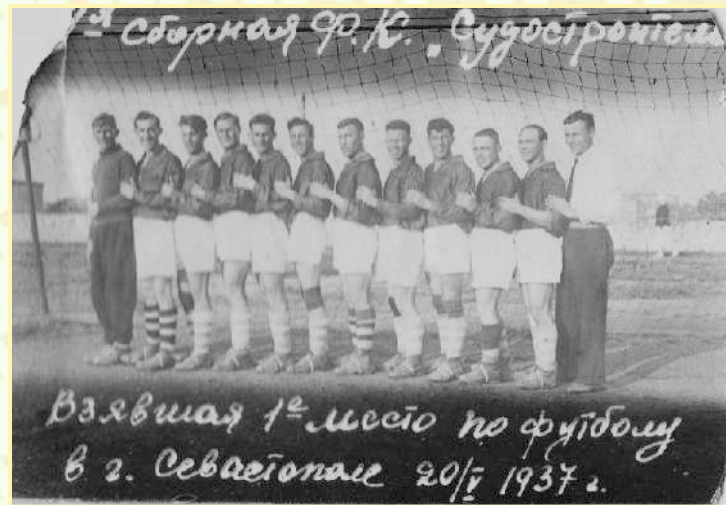
«Судостроитель» первая команда - чемпион Севастополя 1937 года