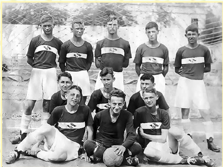
Юноши «Спартак». Севастополь, 1939 г.