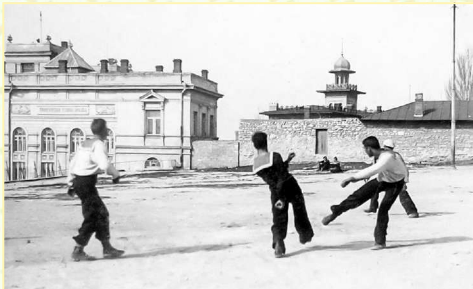
Футбол на Приморском. 20-е годы