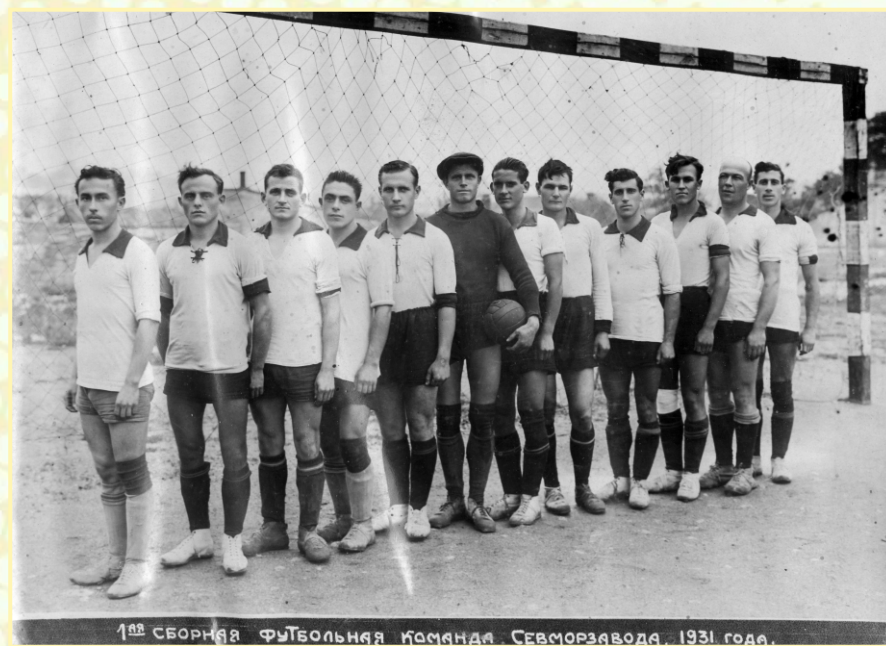
Первая сборная футбольная команда Севморзавода. 1931 г.