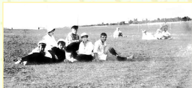
Болельщики на Куликовом поле 1915 г.