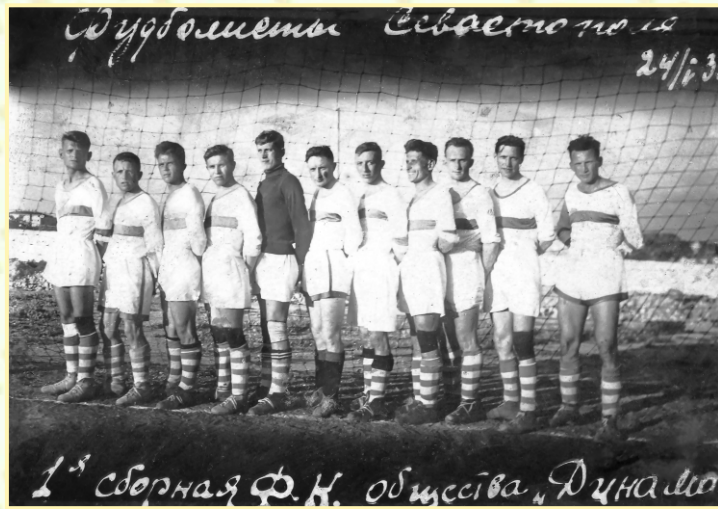
Сборная «Динамо». 1936 г.