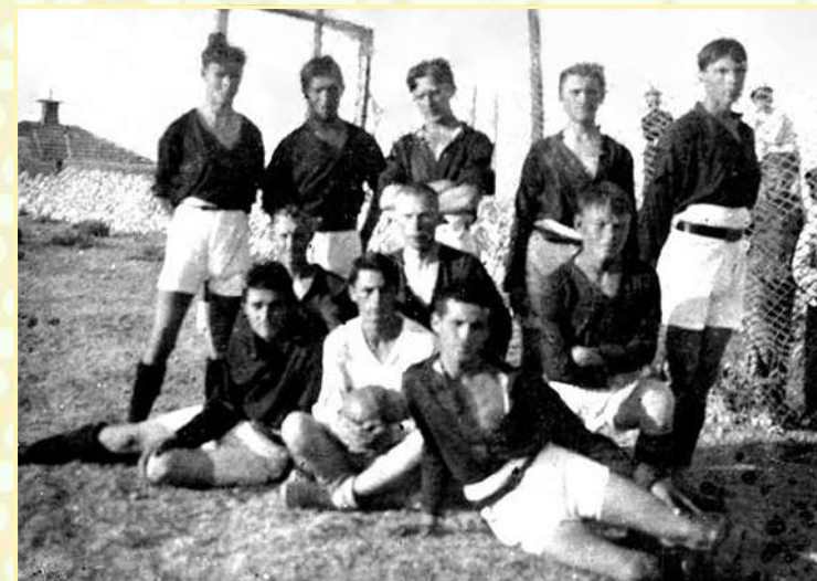
Знаменитая Севастопольская команда «Рекс». 1920 г.