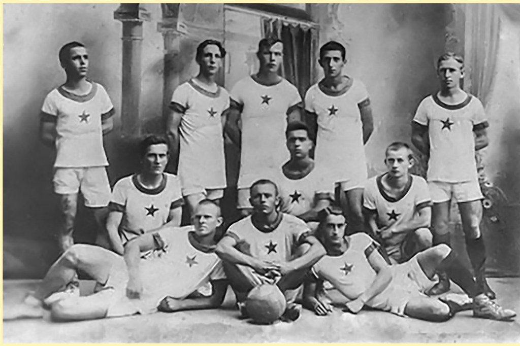
«Юный Металлист» 1924 г.