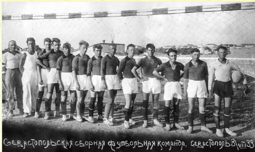
Сборная Севастополя. 1933 г.