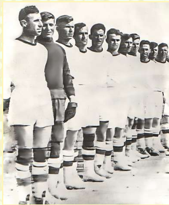
Сборная Севморзавода в 1940 году