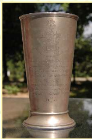
Кубок дореволюционного футбольного Севастополя. 1916 г.