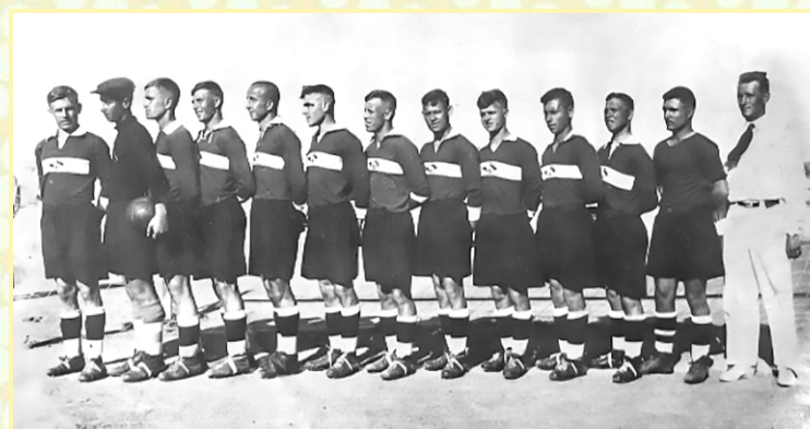
Сборная «Спартак». Севастополь