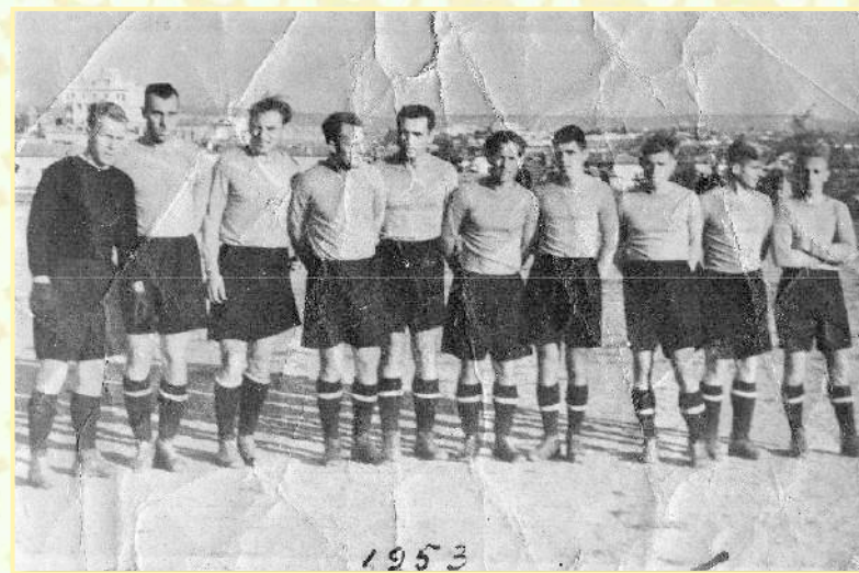
«Авангард» Севастополь перед игрой с «Динамо» Киев. 1953 г.