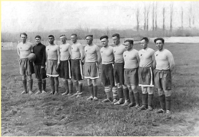
Команда Морчастей погранвойск на старом стадионе в Балаклаве