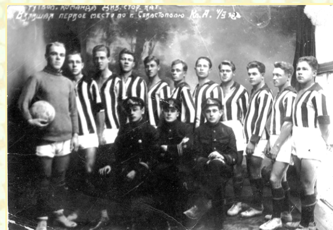
Команда дивизиона сторожевых катеров взявшая Первое место по Севастополю 04.11.193...г.