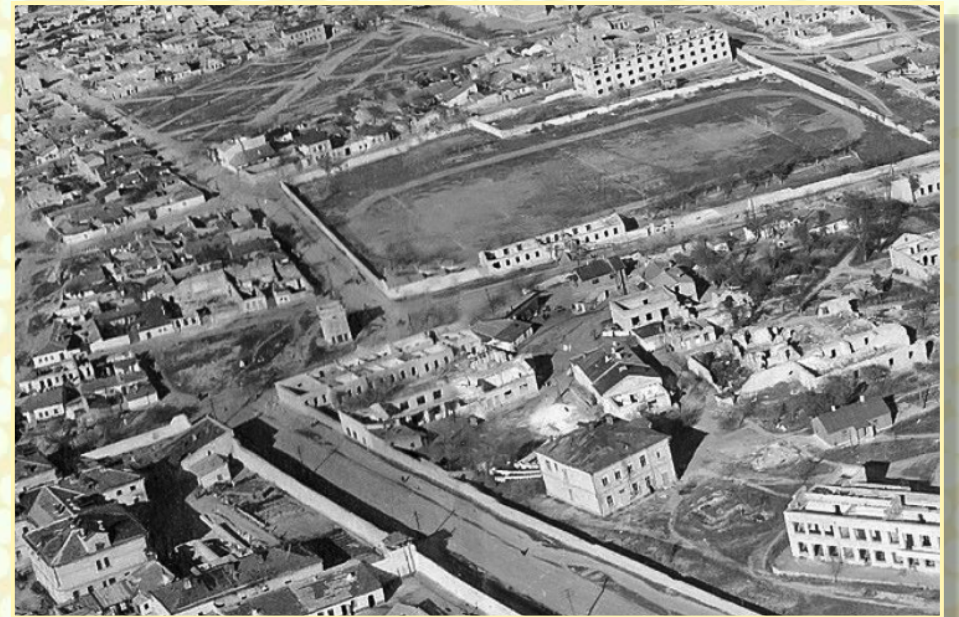
Стадион Севморзавода после войны

- в 1963 году на этом стадионе, на тот момент уже носивший название «Авангард» (в 1964-65гг. - СК «Севастополь») , произвели реконструкцию , и с 1964 года стали проводить свои матчи Первенства СССР по классу «Б» заводская команда «Чайка» . В 1966 году стадион был переименован в «Чайку» .