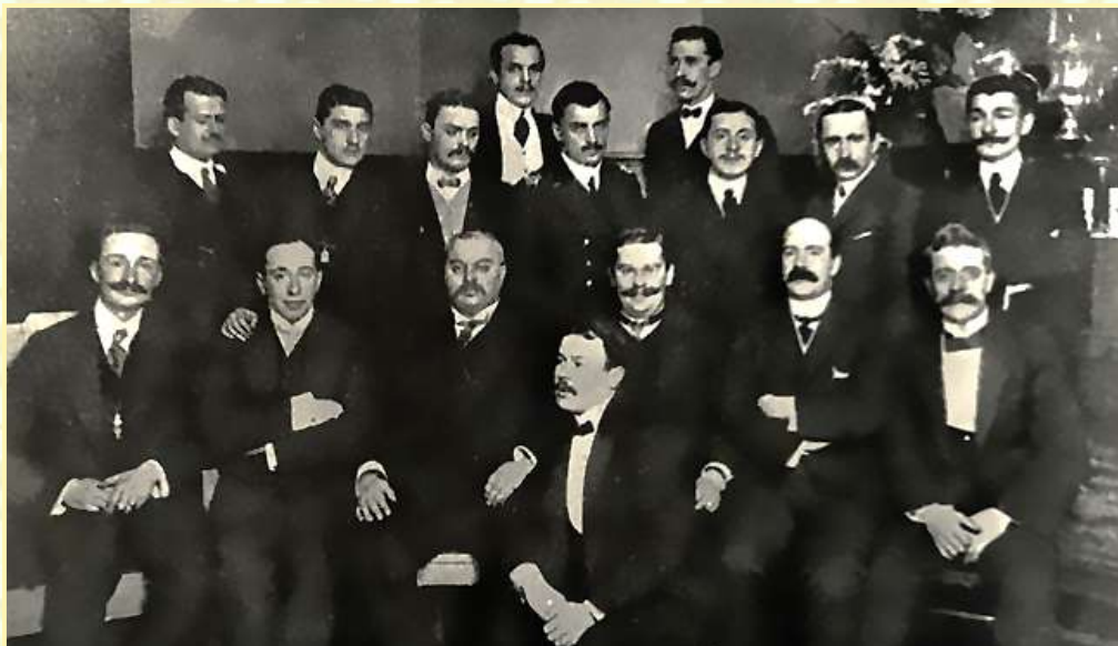
Учредители Всероссийского Футбольного Союза 1912г.