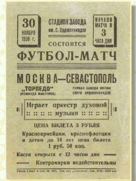
Лицевая сторона программки