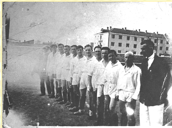
Старый Футбольный Севастополь

Москву, где выступая в составе довоенного московского «Спартака» , выиграл «серебро» Чемпионата СССР , играя за московский «Металлург» , завоевал «бронзу» , и, наконец, в 1940 году в составе московского «Динамо» , стал Чемпионом СССР! А, позже, в победном 1945 году , выступая за ЦДКА , выиграл Кубок СССР!