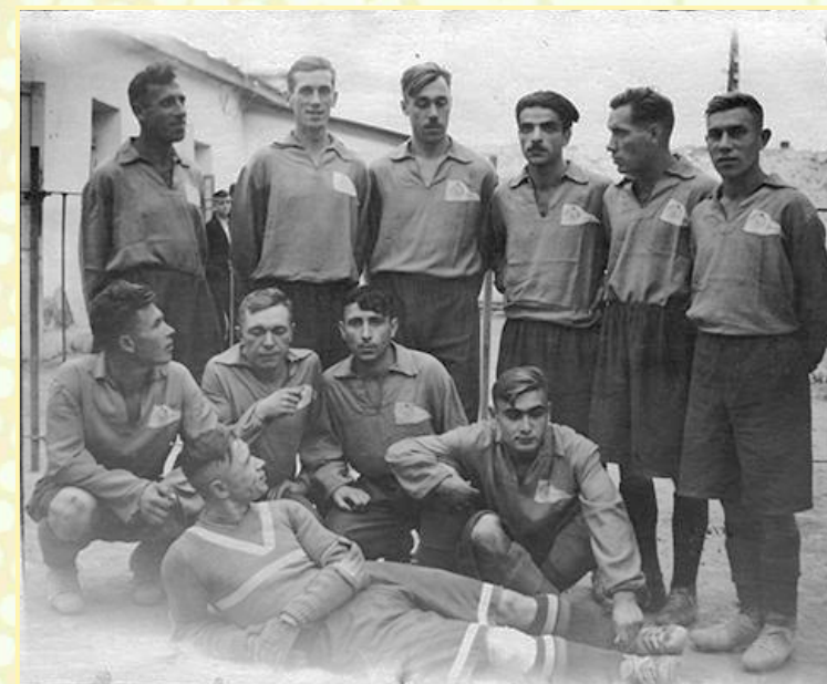
«Судостроитель» 1948 г.