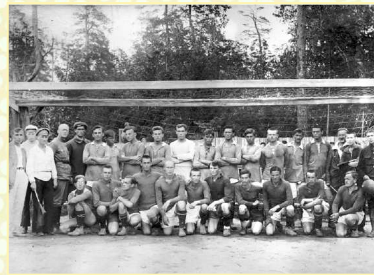
Московский ОГПВ (предшественник ЦСКА) и «Рекс». 27.07.1921 г.