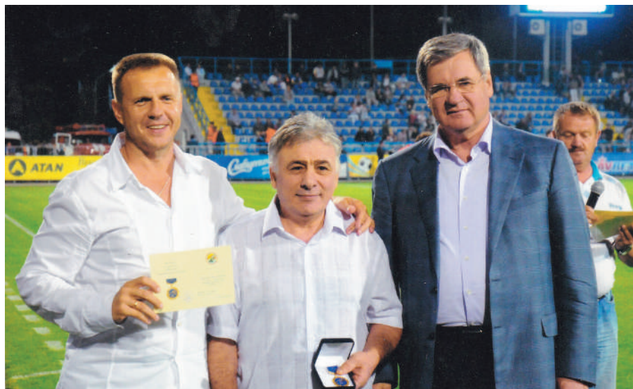
С наградой от Севастополя на празднике, посвященном 100-летию Севастопольского футбола.

И мне очень приятно оттого, что я смог внести малую толику в его развитие. И за это меня наградили в год столетия Севастопольского футбола!