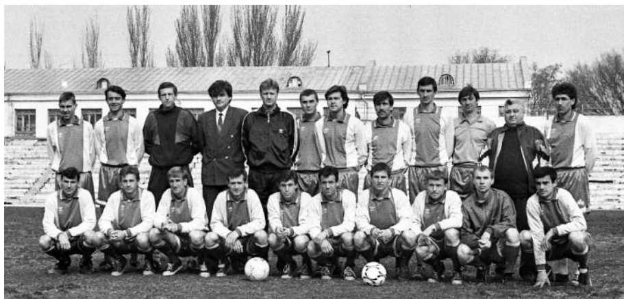
ФК «Чайка» 1995 год. Весна.