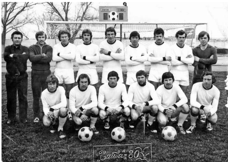
Команда «Чайка» 1980 г.