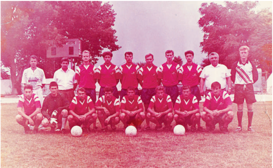
ФК Чайка 1992 г.