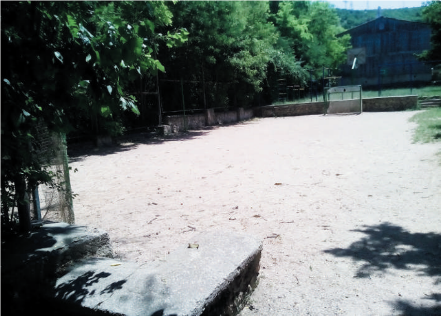
Современная площадка. А на заднем плане та, где мы играли в детстве.

На одной из них, на баскетбольной, постоянно кипели футбольные страсти!