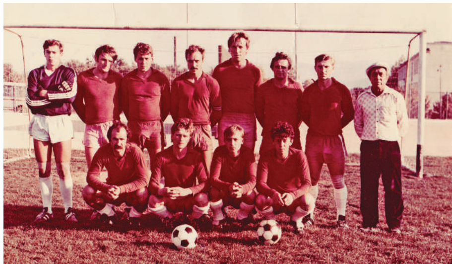
Сахарка – 1987 г.

Закончил восьмой класс, и, хотя меня приглашали продолжить обучение в школе дальше, я решил пойти учиться в ГПТУ № 3. Дело в том, что там в то время серьезно занимались футболом, и