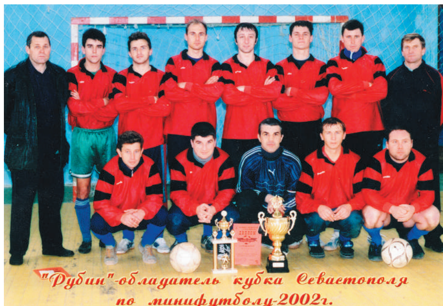
Рубин – обладатель Кубка города по мини-футболу 2002 г.