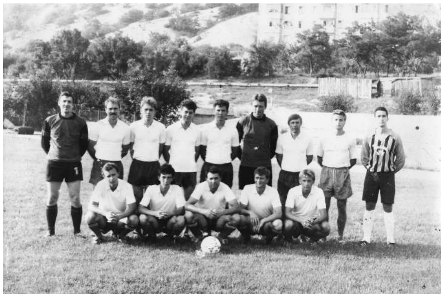
Чемпионы Крыма по Колосу 1986 г.