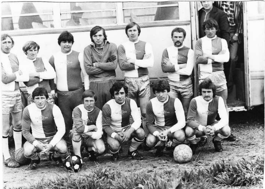
Строитель 1978 г. На выездной игре.

Воспитанники очень любили его, так как чувствовали, что все, что он делает для них, идет от сердца, от души!