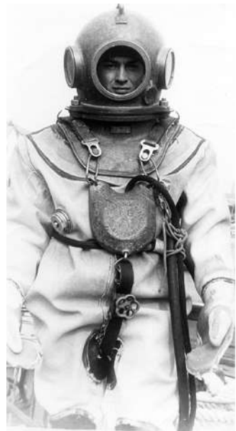
Я – водолаз!

Все прошел по полной программе в школе водолазов. И теория, и практика,