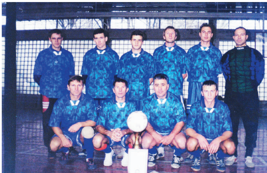
Рубин 1994 год. Первое место по мини-футболу

С 1978 года он играл за команды «Строитель», «Рубин», «Колос», ТЭЦ.