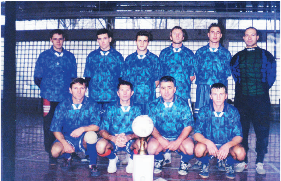
Рубин 1994 г. Первое место по мини-футболу.

Начальство одобрило, поставив только одно условие. Название команды должно быть изменено на «Рубин». Все-таки, виноделие!