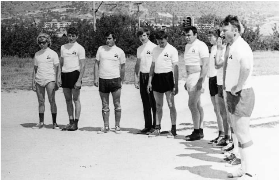
ИЗСМ Строитель 1974 г.

Да и мы его признали. За его фанатичную любовь к футболу, за порядочность, за честность. Он никогда не боялся сказать людям