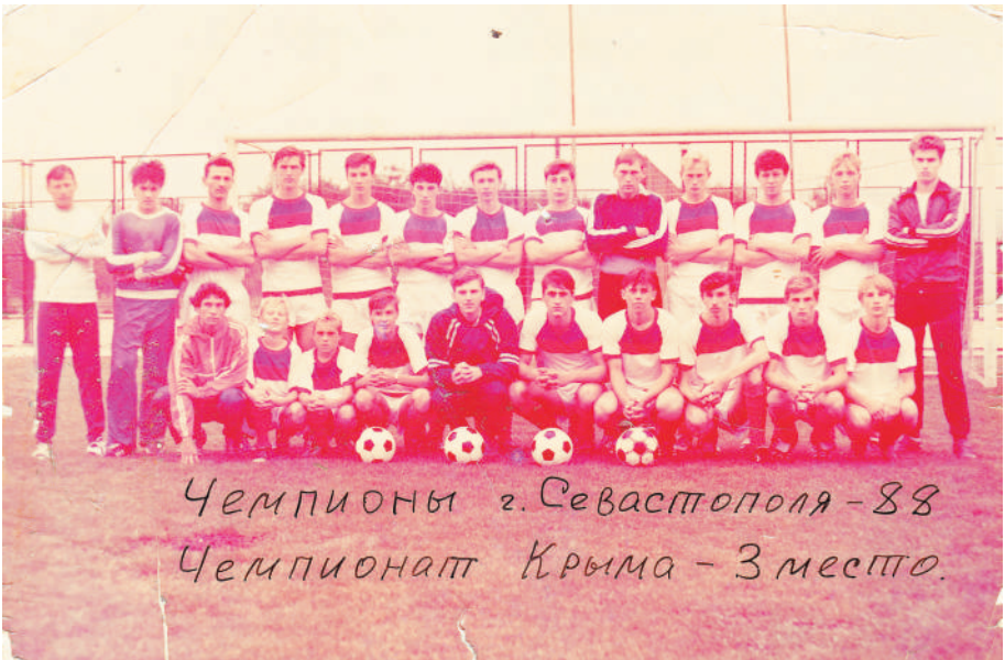
1988 г. Молодежка Колоса. Чемпионы города по 2 группе и 3 место на Крым по Колосу.

В 1988 году мы заняли в Первенстве Крыма среди молодежных команд 3 место, а в клубном зачете стали победителями Первенства Крыма. Это было круто!