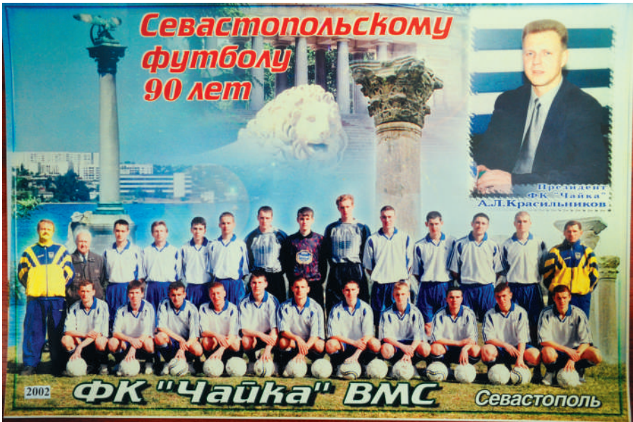
Чайка ВМС 2002 г.