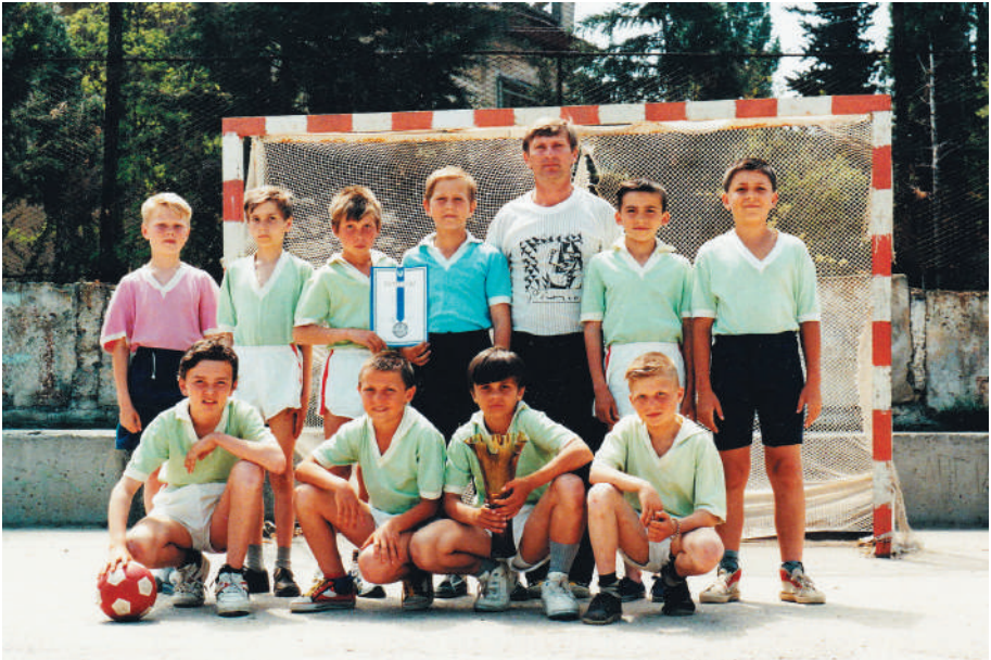
Команда СШ№12 1987 года рождения 2 место в Первенстве Севастополя по мини-футболу. 1997 г.

В городе многие тренера, работающие с детьми за всю свою карьеру не добивались того, что я сделал на общественных началах!