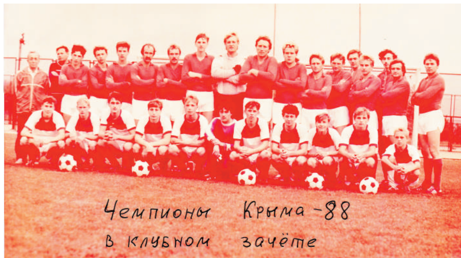
Футбольный Клуб Рубин. Первая и вторая команды.