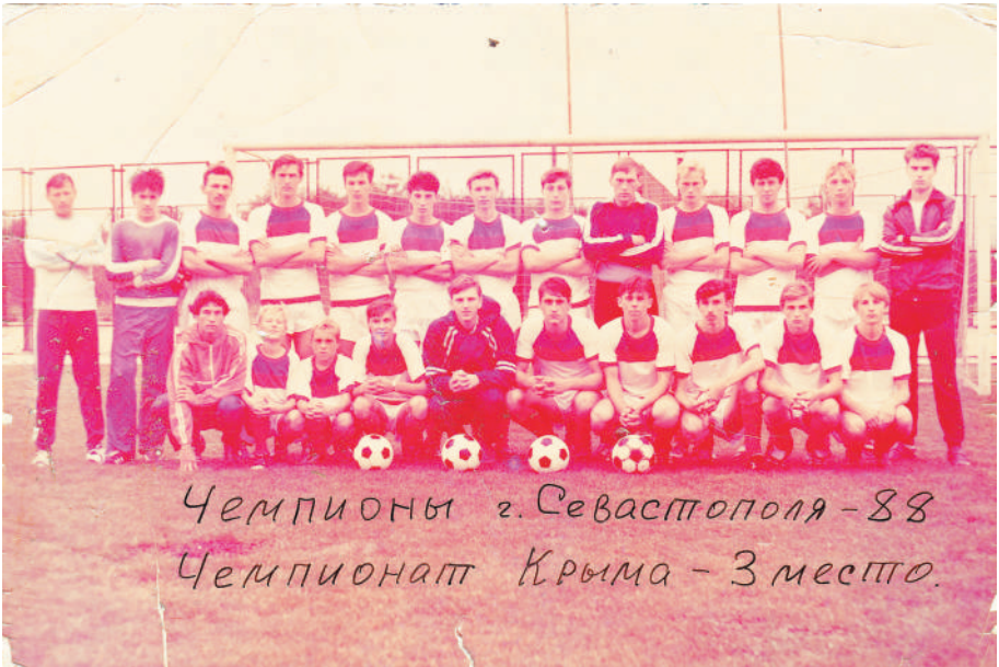
1988 г. Чемпионы города по 2 группе и 3 место на Крым по Колосу