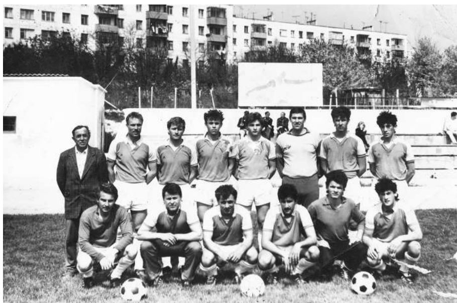
Колос 1987 г.