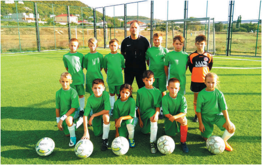
Детская футбольная команда Инкермана Рубин.

тем, что они слоняются по улице без дела. И мне предложили по мере возможностей организовать занятия с детворой.