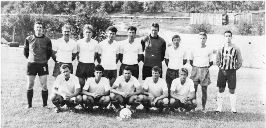
Чемпионы Крыма по Колосу 1986 г.