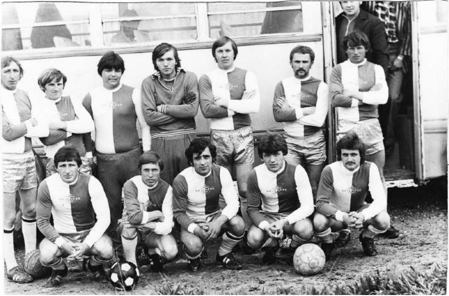
Строитель 1978 г. На выездной игре.

6 мая я «сыграл Дембиль», а уже 9 мая в игре, посвященной Дню Победы играл за них.