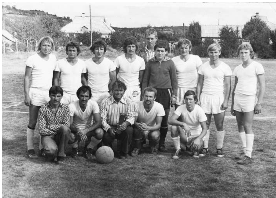
Строитель. Победитель Первенства Крымстройматериалы 1979 г.

Принимали участие в турнире, проводимом трестом «Крымстройматериалы», который выигрывали в 1978, 1979, 1980 годах.