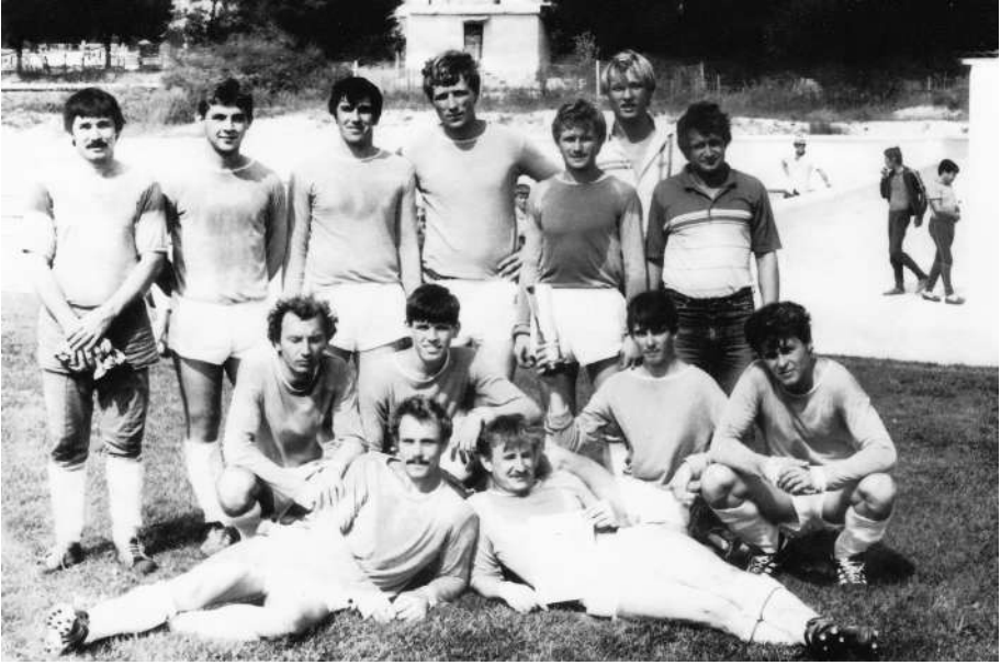
Рубин 1985 год.