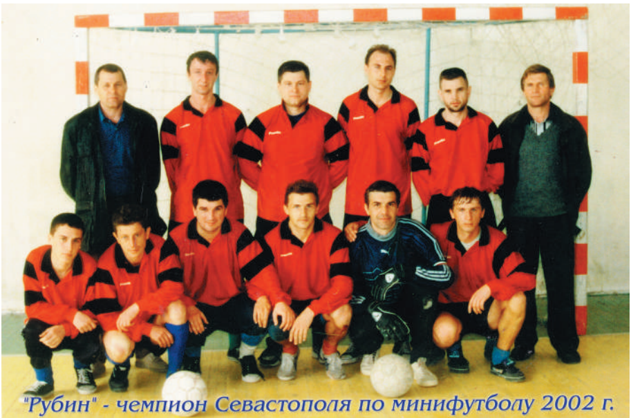
Рубин – Чемпион Севастополя по мини-футболу. 2002 г.