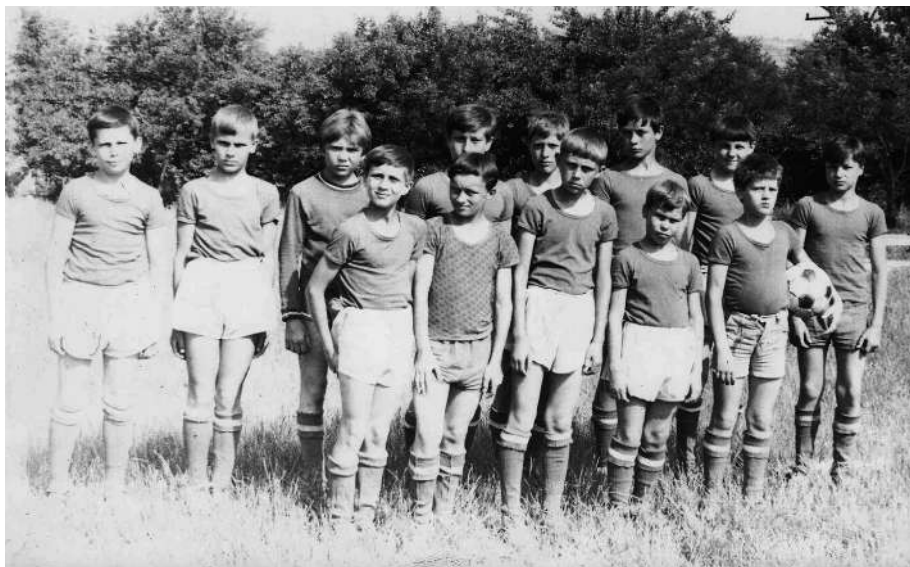
Команда СШ№12 1973 года рождения в 1984 году.

Но тем не менее, я доволен. Доволен и тем, что мои мальчишки почувствовали, что такое настоящий футбол, и результатом доволен. Не совсем, чтобы доволен, но скажем так, удовлетворен! И еще я остался доволен собой, как тренером!