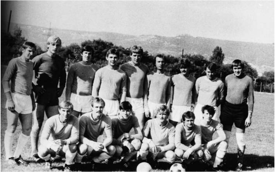
Колос Первенство Крыма.