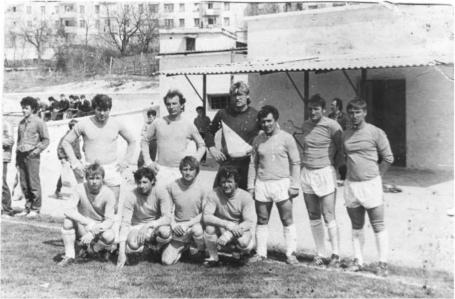
Рубин 1986 год.